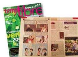
Publication d'une page dans le magazine «Temps Libre»