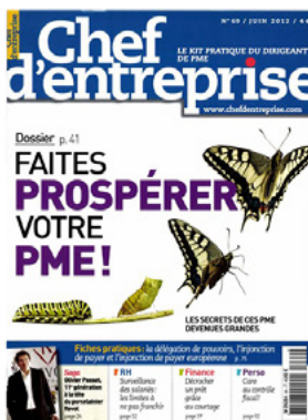
Chef d'Entreprise magazine