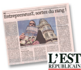
Journal L'EST Républicain