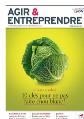
Magazine de la CCI de Lyon