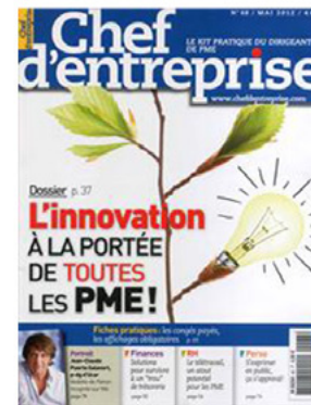
Chef d'Entreprise magazine Mois de mai 2012