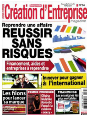
Création d'entreprise magazine. Double page dans le magazine d'Avril