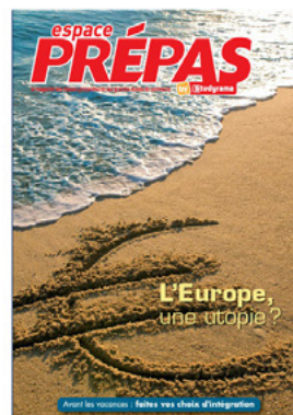
Magazine Espace Prépas